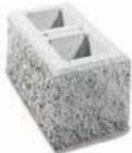
Kamień na mur (początkowy i końcowy) Format: 40 x 20 x 18 cm Rozszczepiany z trzech stron.