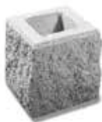
Kamień półkowy (początkowy i końcowy) Format: 20 x 20 x 18 cm Rozszczepiany z trzech stron.